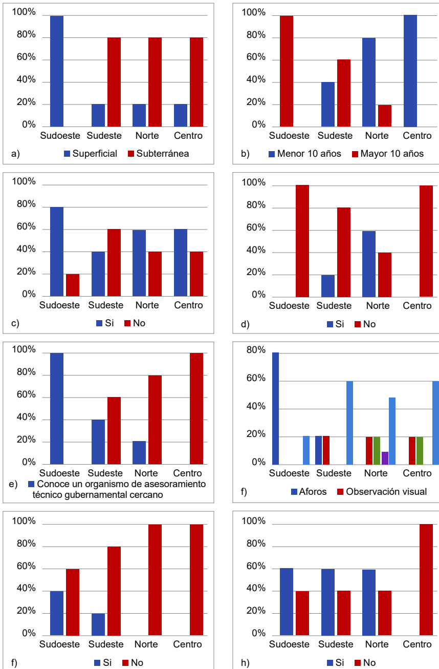
Figura 3. Resultados de las encuestas a los regantes. Se muestra el porcentaje sobre el total de encuestados por cada región de la provincia de Buenos Aires (Norte, Sudoeste, Sudeste y Centro) (n=10) sobre: a) fuente de agua utilizada para el riego (superficial o subterránea); b) antigüedad de la infraestructura utilizada para riego (mayor o menor a 10 años); c) conocimiento de la calidad del agua por parte del productor (si o no); d) existencia de asesoramiento profesional para la gestión del riego (si o no); e) forma en la que determina el momento del riego (aforo, consulta con vecinos, consulta con empresa instaladora, observación visual, estado fenológico del cultivo); f) conocimiento de la presencia de un organismo gubernamental cercano para el asesoramiento sobre el riego (si o no); g) conocimiento de la cantidad de agua de riego que consume por kilogramo producido (si o no); h) conocimiento de la autoridad del agua de la provincia de Buenos Aires (si o no).