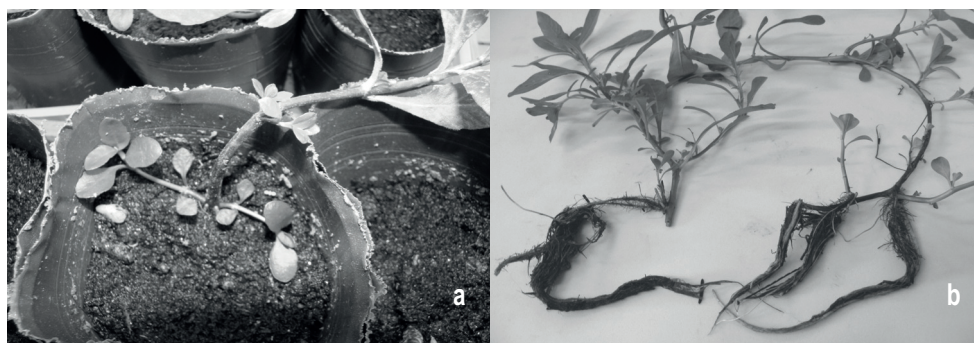
Figura 3. Multiplicación vegetativa artificial de Bidens laevis . a. Esqueje. b. División de mata.