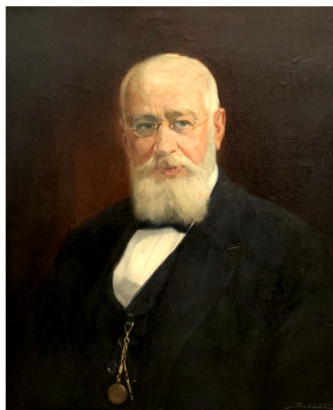
Figura 4. Pedro N. Arata, ca. 1914. Óleo sobre tela realizado por Juan Peláez. Original en la Pinacoteca del Ministerio de Educación de la Nación.

reproducción policroma amablemente cedida por el Ministerio de Educación de la Nación, en cuya pinacoteca se encuentra el original.